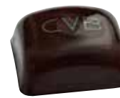
CITRON VERT ET BASILIC Ganache au citron vert basilic