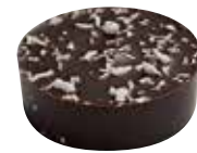
COCO Intérieur à la noix de coco