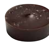
PASSION Intérieur tendre au fruit de la passion, poivre de Sarawak