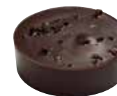
SALENTÒ Ganache au café de Colombie