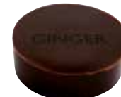
GINGER Ganache au Gingembre