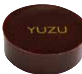
YUZU Ganache au yuzu