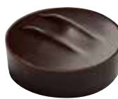
CARAMEL Caramel tendre