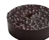
CASSIS ET VIOLETTE Intérieur tendre au cassis et violette