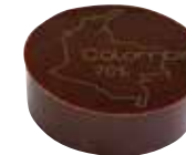
COLOMBIE PURE ORIGINE Ganache au cacao fin de Colombie