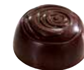
ROSE Ganache à la rose