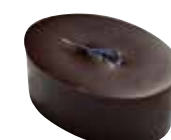
THÉ Ganache au thé Earl Grey