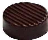
VOANTSY Ganache au poivre sauvage de Madagascar