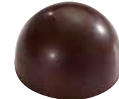
GHANA PURE ORIGINE Ganache Ghana