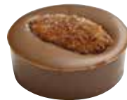
ROCHER LAIT Praliné aux amandes