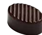
MALDON Ganache lait 40% au sel Maldon