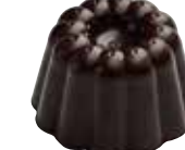
KOUGELHOPF Ganache au Gewurztraminer