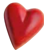
CŒUR Ganache noire à la framboise