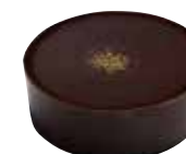
CANNELLE Ganache à la cannelle