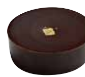
PALET OR Ganache noire 64%