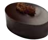
ANTILLES Ganache au Rhum