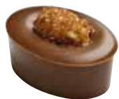
CACAHUÈTE Praliné à la cacahuète