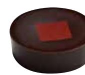
BALSAMICO Ganache au vinaigre balsamique