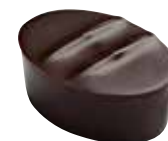
TONKA Ganache à la fève de Tonka