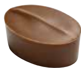
MERVELLE Gianduja noisette